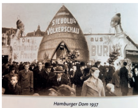
Hamburger Dom 1937