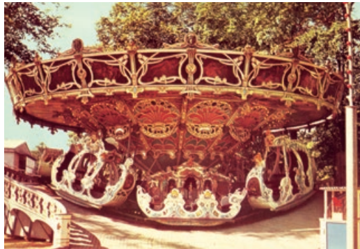
▲ 1904 Berg- und Talbahn Hugo Haase