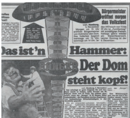
▲ 1981 Hamburger Dom steht Kopf

Ohne Zweifel gelingt es Schaustellern, ob jung oder alt, von je her, gemeinsam zu feiern, Freundschaften zu pflegen und ihre Tradition zu wahren.