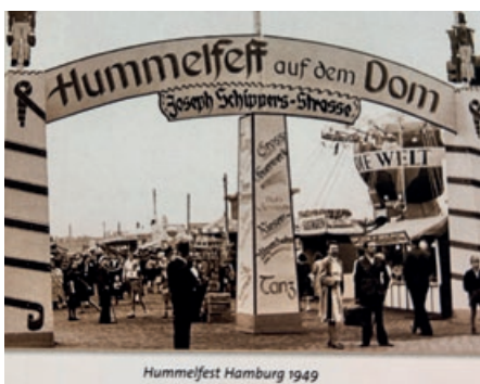
Hummelfest Hamburg 1949