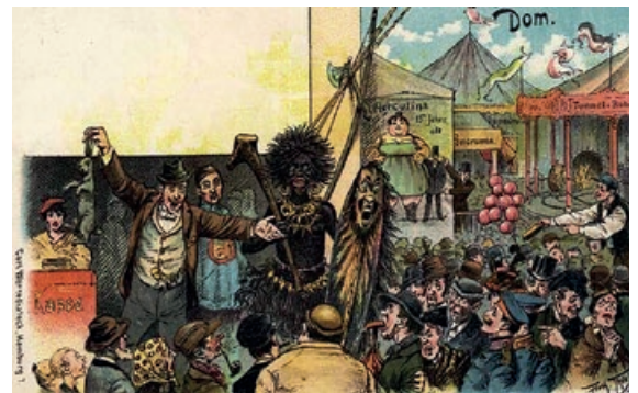
▲ 1930er Jahre Zeitgenössische humoristische Darstellung einer Völkerschau Hamburg

Zurück zum Volksfest Hamburger Dom. Nach Unterbrechung durch den ersten Weltkrieg fand der Winter-Dom im Jahr 1918 wieder statt. 1922 wurde der erste Frühlings-Dom eröffnet.