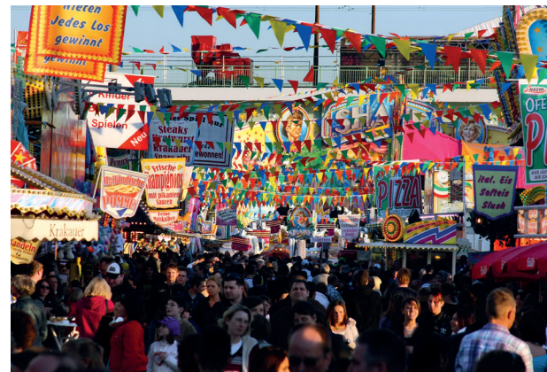
▲ Buntes Treiben auf dem Frühlings-Volksfest in Köln. Menschen lieben den Bummel über einen Festplatz