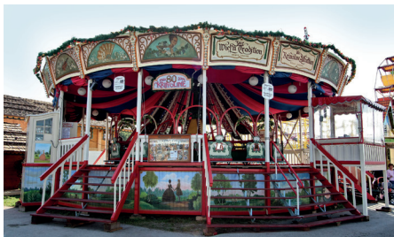
▲ Krinoline. Erbaut Ende des 19. Jhr. erfreut sie noch immer Fahrgäste aus der ganzen Welt

Am 19.03.2021 kam die Ernüchterung / Die deutsche Expertenkommission der UNESCO stellte unseren Antrag zurück, gewährte jedoch eine Überarbeitung. Die Kommission bemängelte die Angaben zur „ differenzierten historisch-kritischen Reflexion der Geschichte und Entwicklung der Kulturform “, außerdem waren die geplanten „ Erhaltungsmaßnahmen “ und die „ lokale und regionale Identitätsstiftung “ nicht befriedigend dargestellt. Letztendlich war nicht ausreichend erläutert worden, wer die „ Trägerinnen und Träger der Volksfestkultur “ sind. Wir hatten uns strikt an die Fragestellungen gehalten, jedoch erschwerten die strengen Kriterien und