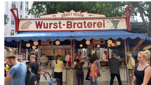
▲ Wurstbraterei Vosen. Seit über 100 Jahren verkauft die Familie Vosen Bratwürste nach eigenem Rezept