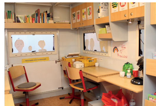
▲ Blick in ein Schul-Mobil auf einem Volksfestplatz

In diesem Sinne wollen wir uns alle gemeinsam freuen, dass die „Schaustellerkultur auf Volksfesten in Deutschland“ in das Bundesweite Verzeichnis des Immateriellen Kulturerbes der UNESCO aufgenommen wurde und damit für alle Zeiten geschützt sein wird.