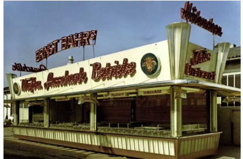
Imbiss und Ausschank