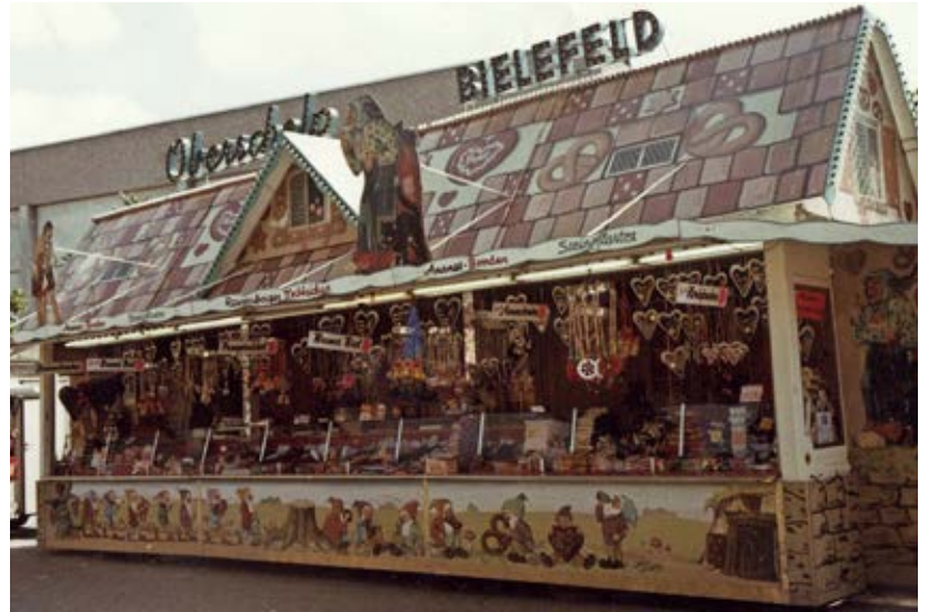
1985 Knusperhaus Oberschelb Bielfeld Melser