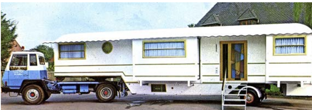
Wohnwagen Stork Sattelaufleger