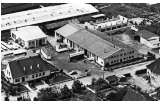
2. Werk | Galgenstatt Neubau Schreinerei

Längst war die Wohnsituation der Schausteller Welten entfernt vom Klischee des Fahrenden Volkes, das mit Pferd und Wagen von Ort zu Ort zog. Für die Bevölkerung war es jedoch immer noch schwer vorstellbar, dass die Wohnwagen zu eleganten „Wohnungen“ auf Rädern entwickelt worden waren.